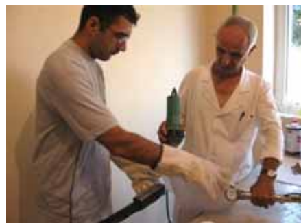
Qendra e Protezimit në Spitalin Rajonal të Kukësit