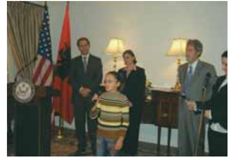
Darka e Njëmijë Gostive

janë dërguar në Qendrën e Protezave në Kukës.