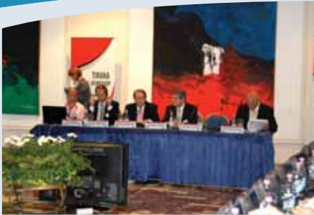
Kryetari i AMAC në Seminarin Rajonal të Tiranës për një Europë Juglindore pa Mina, Tetor 2009

PROGRAMI SHQIPTAR PËR VEPRIMIN NDAJ MINAVE