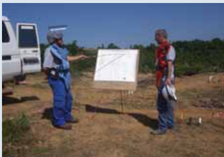
Operacione të kontrollit të cilësisë të AMAE-së

nat dhe municionet e paplasura në Shqipëri. Përgjegjësitë e AMAE-s përfshijnë koordinimin dhe monitorimin e të gjitha aktiviteteve të Veprimit ndaj Minave në vend. Në këtë mënyrë AMAE cakton prioritetet, zhvillon dhe koordinon të gjitha operacionet bazuar në Planin Kombëtar të Veprimit ndaj Minave. Agjencitë zbatuese të Programit të Veprimit ndaj Minave akreditohen nga