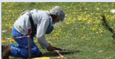
Çminim manual nga DCA

Që nga viti 1999 deri në fund të 2009, rreth 16,608,055 milionë metra katrorë tokë (duke përfshirë edhe zonat shtesë të ndotura të identifikuar gjatë survejimit) janë pastruar përmes operacioneve të survejimit dhe çminimit dhe më pas i janë dorëzuar banorëve në veri-lindje të Shqipërisë për