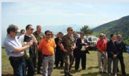
Udhëtim me donatorët në zonat e prekura nga minat në Qarkun e Kukësit

nat dhe municionet e paplasura në Shqipëri. Përgjegjësitë e AMAE-s përfshijnë koordinimin dhe monitorimin e të gjitha aktiviteteve të Veprimit ndaj Minave në vend. Në këtë mënyrë AMAE cakton prioritetet, zhvillon dhe koordinon të gjitha operacionet bazuar në Planin Kombëtar të Veprimit ndaj Minave. Agjencitë zbatuese të Programit të Veprimit ndaj Minave akreditohen nga