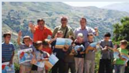
Aktivitetet për Edukimin mbi Rrezikun ndaj Minave

Megjithëse shumica e njerëzve në verilindje të Shqipërisë u informuan dhe u edukuan mbi rrezikun e minave, përsëri banorët u përballën me rrezikun për arsye të nevojës ekonomike që i detyronte të përdornin zonat e minuara. Që nga viti 1999, kanë ndodhur 210 aksidente me mina, 34 persona janë vrarë dhe 238 u plagosën; afërsisht një e treta ishin në moshë aktive për punë nga 15-45 vjeç në momentin e aksidentit ndër-