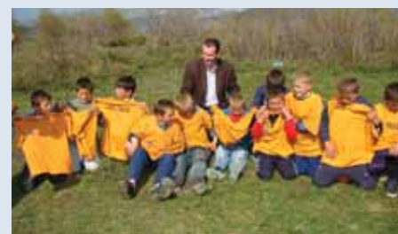
Fëmijët gjatë një aktiviteti të MRE-së

nën manaxhimin e kompanisë "DanChurchAid" përmes një projekti të financuar nga Komisioni Europian përmes PNUD Shqipëri. Qysh prej vitit 2007 DCA ka operuar me një kapacitet kombëtar dhe vetëm me një manaxher ndërkombëtar. Operacionet e çminimit gjatë gjithë këtyre viteve janë financuar nga Departamenti