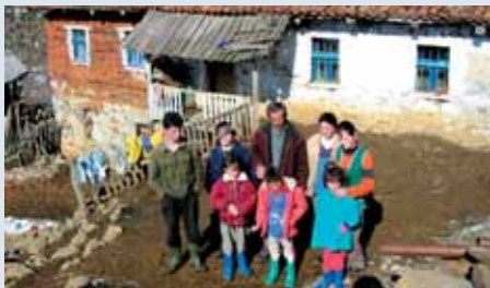
I aksidentuar nga minat me familjen e tij.

Ndotja me mina/municione të paplasura preku Prefekturën e Kukësit në veri-lindje të Shqipërisë, që është një nga zonat më të varfëra në vend. Aktivitetet kryesore të banorëve janë bujqësia, blegtoria, mbledhja e drurëve të zjarrit e aktivitete të tjera për mbijetesë. 39 fshatra në verilindje të Shqipërisë me një popullsi rreth 25,000 u prekën fillimisht nga ndotja me mina. Problemi i minave ka patur një ndikim negativ në zhvillimin e infrastrukturës dhe tek mjedisi duke u bërë një pengesë serioze për zhvillimin e eko-turizmit në këtë rajon.