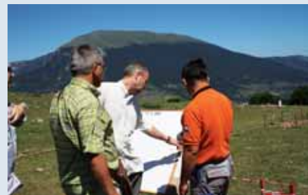
Eksperti zvicerian gjatë një vizite në terren, Kukës

Në veçanti, PNUD dhe Fondi Ndërkombëtar i Besimit në Slloveni (ITF) kanë luajtur rol kryesor në ndërtimin e kapaciteteve të AMAE-s dhe të Kapacitetit Kombëtar të Çminimit nëpërmjet asistencës teknike dhe trajnimeve. Gjithashtu AMAE është mbështetur në ndërtimin e kapaciteteve edhe nga Qendra Ndërkombëtare e Çminimeve Humanitare në Gjenevë (GICHD), UNMAS dhe Shtabi i Përgjithshëm Zvicerian. Partnerë të tjerë zbatues të Programit të Veprimit ndaj Minave gjatë gjithë këtyre viteve përfshijnë: autoritetet lokale në Qarkun e Kukësit,