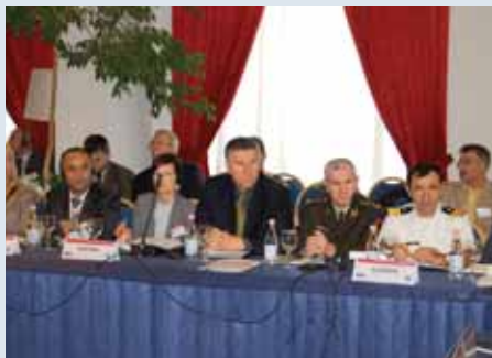
Delegacioni Shqiptar në Seminarin Rajonal të Tiranës për një Europë Juglindore pa Mina, Tetor 2009