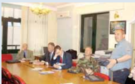
Vizita e përfaqësuesve të Departamentit Amerikan të Shtetit në zyrën e AMAE-së