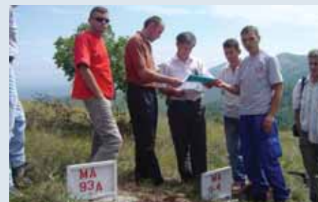
Ceremoni e dorëzimit të tokës së pastruar

Në vitin 2006, u krijua një kapacitet lokal çminimi me gjashtë skuadra çminuesish manual