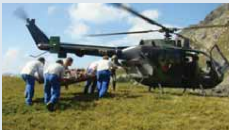
Mbështetje me helikopter nga Min. e Mbrojtjes

Qeveria Shqiptare në vitin 1999, ngriti strukturat për zbatimin e Programit Shqiptar të Veprimit ndaj Minave (AMAP). Politikat dhe strategjitë u formuluan nga Komiteti Shqiptar i Veprimit ndaj Minave (AMAC) dhe u zbatuan nga Qendra Shqiptare e Veprimit ndaj Minave (AMAE). Gjithashtu Qeveria Shqiptare që nga viti 1999 deri në vitin 2009 ka kontribuar në natyrë dhe me materiale të tjera në mbështetje të programit me një vlerë totale prej 2,700,000 USD. Qysh prej vitit 2005 Qeveria Shqiptare nëpërmjet Ministrisë së Mbrojtjes ka mbështetur në veçanti operacionet e çminimit duke dhënë fjalas materiale eksplozive dhe duke siguruar shër-